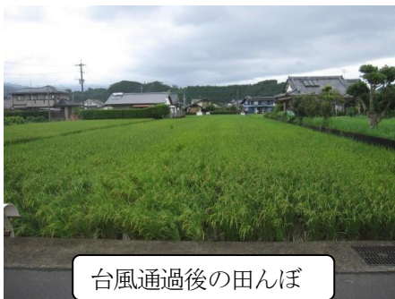
台風通過後の田んぼ

竹の伐り出しの日16日は、ちょうど台風16号接近で 雨風が強く、残念ながら中止となりました。 幸い、台風そのものは大した影響もなく、稲は少々倒れた ものもありながら、しっかり育ってくれているようです。 草取りも終わったお盆以降、しっかり根を張ってくれてい たんでしょうか。そして、土と太陽から栄養をもらい実を つけています。稲の力に脱帽です！！