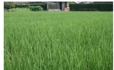
こんなに大きくなりました