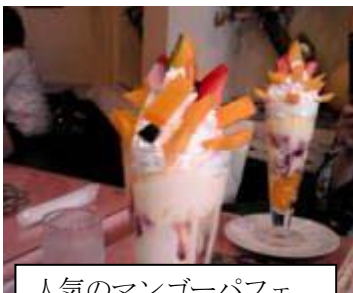
人気のマンゴーパフェ フルーツ大野にて