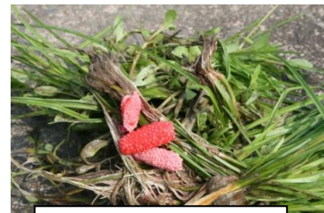
ジャンボタニシの卵