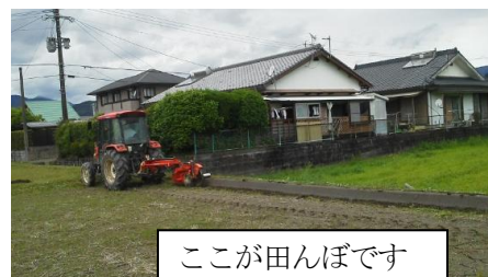
ここが田んぼです