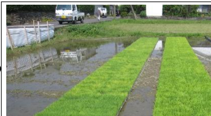
苗がこんなに伸びています