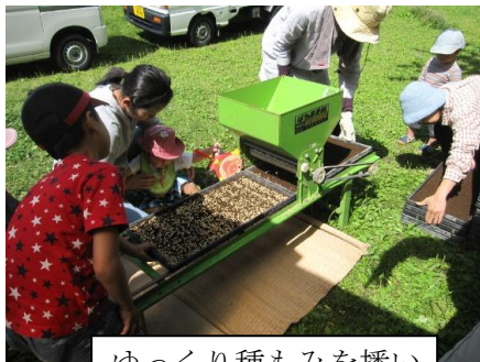
ゆっくり種もみを播い ていきます