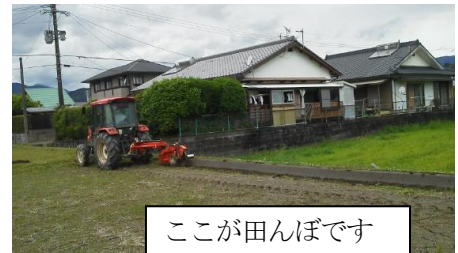
ここが田んぼです