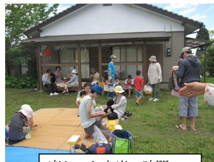
楽しいお弁当の時間