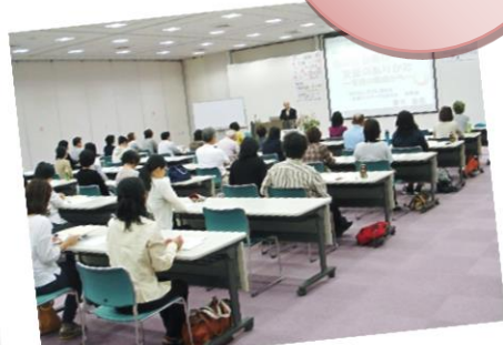
ひきこもりと発達障害学習会