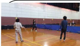
体育館で汗を流し

何をしても何もしなくてもOK ゆったり、まったり、おしゃべり、ゲーム、 ピアノ、お茶を飲んだりお菓子を食べたり、好きなように利用しています。